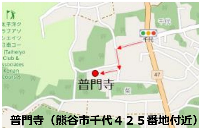
普門寺(熊谷市千代425番地付近)