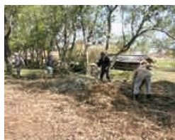
宮代水と緑のネットワーク

主な活動内容 宮代町及び周辺地区に自生する希少種の野草を8か所の野草保全地に移植し、増殖、外来種の抜き取り、除草などの保全活動を行っている。また、「野草観察会」「野草保全地の一斉草刈りと芋煮を楽しむ会」「野草を語る会」などの開催を通し、一般市民の理解促進と啓発を図っている。