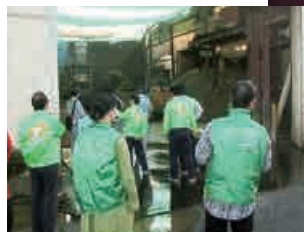
環境ネットワークよしかわ

主な活動内容 17の団体と9名の個人からなるネットワーク組織で、市・企業と協働し、市からの委託5事業、独自の7事業を実施している。全40講座の環境出前授業の実施、環境展・環境フェスティバルの開催、緑化推進、マイバッグ持参推進運動、工業団地内企業と協働での環境パトロールなど、多彩な事業を多数実施している。